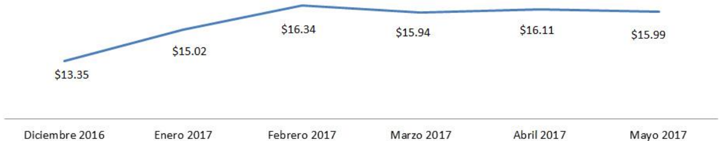
Histórico de precios del Kg. de gas LP

En diciembre de 2016, el kilogramo de gas LP tenía un precio promedio final al público a nivel nacional de $13.35 pesos, mismo que al 15 de mayo subió a $15.99 pesos por kilogramo, según reportan los distribuidores a la Comisión Reguladora de Energía (CRE).